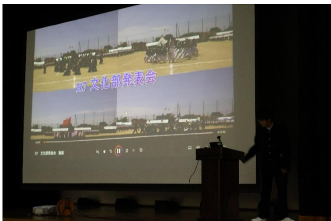
◇放送部「アトラク編集動画」①