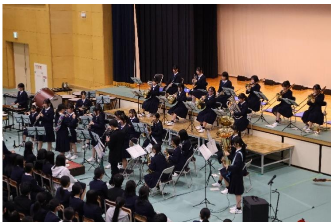
◇吹奏楽部「31 flavors of Sound」①